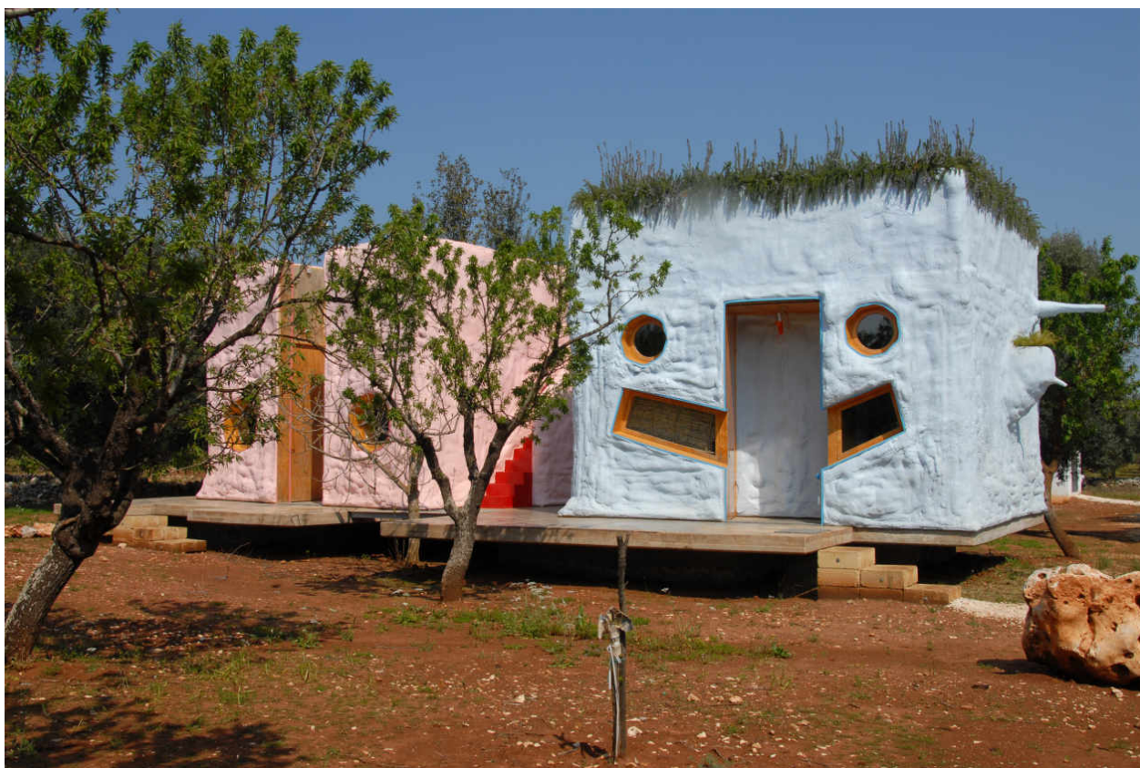
Pescetrullo, maison en polyuréthane de Gaetano Pesce, près d'Ostuni (Italie).

Un trullo, c'est une cahute de pierre sèche, typique de la région des Pouilles, dans le sud de l'Italie. Traditionnellement utilisés comme abris temporaires ou habitations permanentes pour les petits propriétaires et