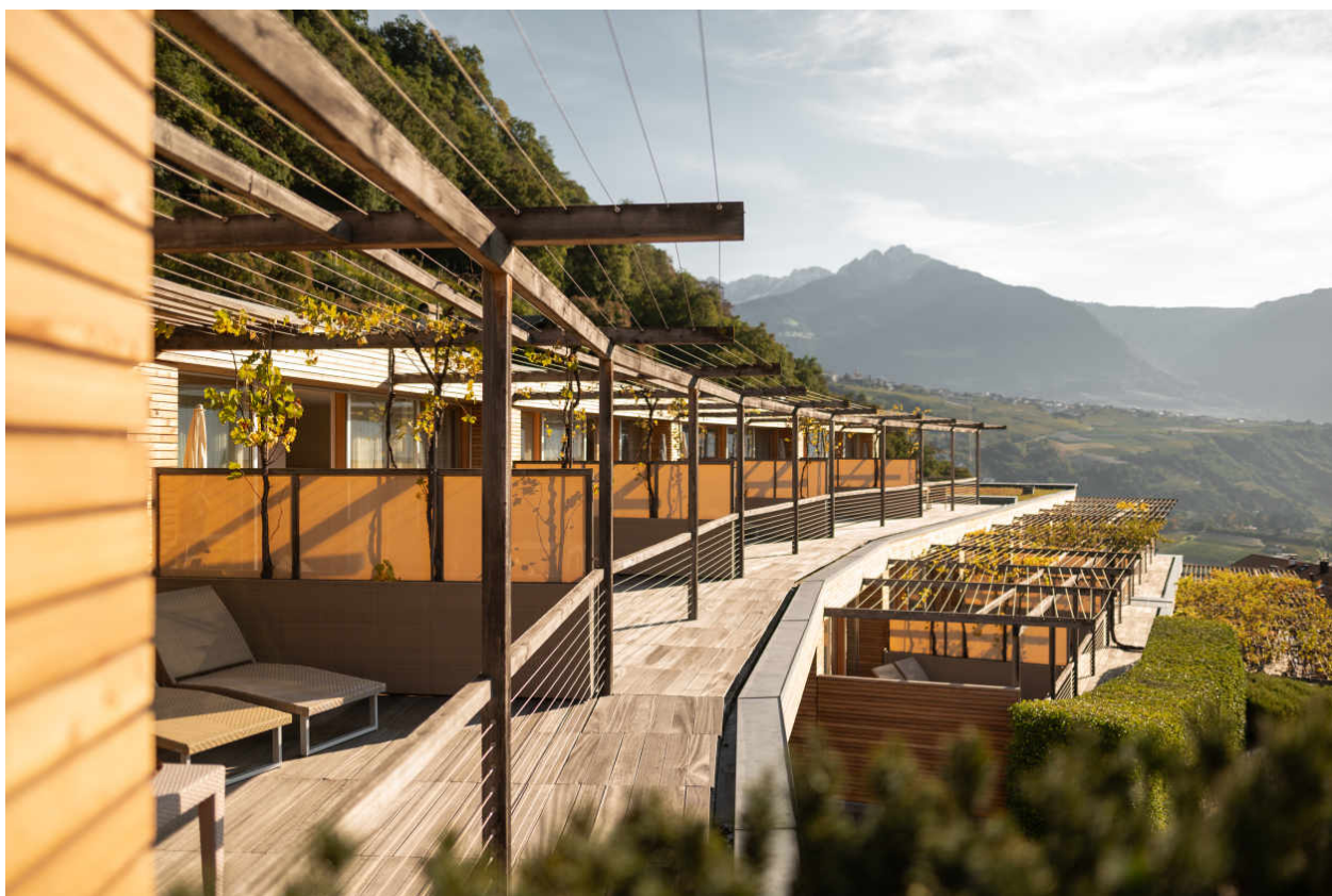
La Pergola Residence, de Matteo Thun, à Lagundo (Italie).

Du groupe Memphis, on connaît évidemment Ettore Sottsass , monstre du design italien. Les noms de ses compagnons de route sont malheureusement moins connus. Parmi eux, l'architecte et designer italien Matteo Thun. Celui-ci a signé la Pergola Residence, un appartement-hôtel à Lagundo, dans le Haut-Adige, en Italie.