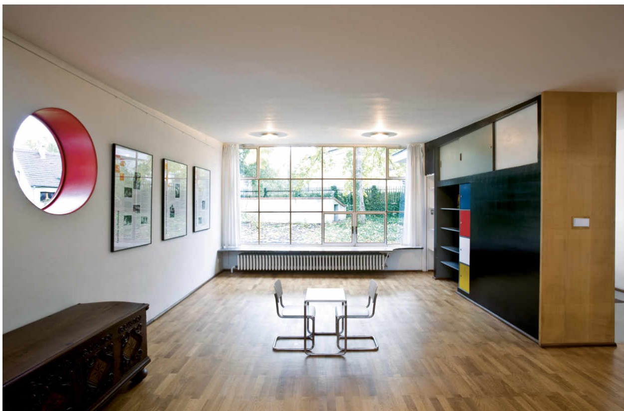
La Haus Schminke, à Löbau (Allemagne).